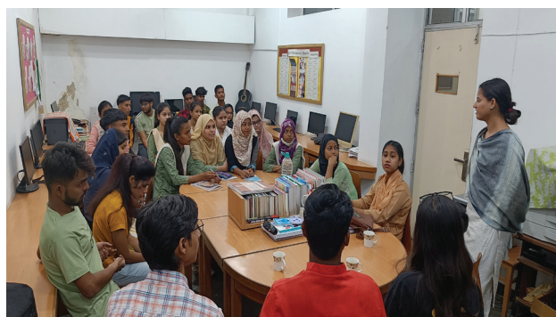
Foto: Englischkurs im nun zerstörten Computerlabor